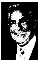
GERARD BAUDRU PRÉSIDENT DE L'UGEC