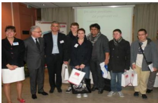
DCG 3 2012-2013 du lycée Benjamin Franklin